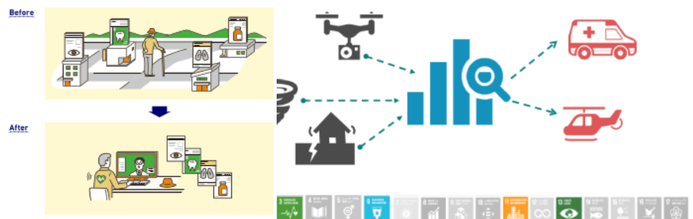
Gambar 3. Layanan kesehatan dan pencegahan bencana Society 5.0 (Government, 2018)

Gagasan era baru ini mengintegrasikan tempat di mana manusia ada secara fisik dengan dunia maya ( cyber space ). Teknologi mutakhir dioptimalkan untuk mewujudkan manfaat yang lebih luas untuk manusia. Berbeda dengan revolusi industri 4.0 yang fokusnya terhadap optimalisasi berbagai teknologi dan sistem informasi dalam bidang produktivitas industri bisnis (D. Setiawan & Lenawati, 2020). Selain itu, penerapan society 5.0 diarahkan untuk memenuhi tujuan Sustainable Development Goals (SDGs) atau tujuan pembangunan berkelanjutan yang disepakati oleh 193 negara di markas PBB tahun 2015 meliputi 17 tujuan di antaranya, mengakhiri kemiskinan, menciptakan ketahanan pangan, terciptanya kehidupan yang sehat, terwujudnya pendidikan yang inklusif dan setara dalam kualitas dan tujuan lainnya. Untuk mewujudkannya negara Jepang merencanakan sembilan layanan untuk masa depan menggunakan teknologi berbasis manusia contohnya one platform for health dan mitigasi bencana. (Al Faruqi, 2019).