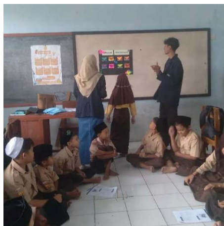
Gambar 3. Pelaksanaan Penelitian Siklus II

Berdasarkan hasil pengamatan dan pelaksanaan pembelajaran yang dilakukan, dapat disimpulkan bahwa dengan penerapan model pembelajaran talking stick sangat menyenangkan dan mampu menumbuhkan motivasi belajar pada siswa. Selama proses kegiatan belajar berlangsung, peserta didik mampu berpartisipasi secara penuh yang berdampak positif terhadap hasil belajar pada materi shalat idain. Kemudian dengan penerapan model tersebut di dalam kelas dapat mendorong siswa berperan aktif di kelas dan lebih berani untuk mengemukakan pendapatnya sendiri. Nilai dan ersentase materu yang tercakup dari siklus I dan siklus II dibandingkan pada tabel di bawah ini.