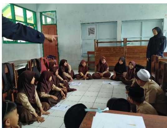
Gambar 2. Pelaksanaan Penelitian Siklus I

Pada tahap siklus I, peneliti melakukan modifikasi kegiatan belajar dengan menerapkan model pembelajaran yang lebih melibatkan siswa. Perbaikan ini dilakukan sebagai respons terhadap rendahnya hasil ketuntasan belajar siswa pada prasiklus. Dengan menerapkan model pembelajaran talking stick pada pembelajaran fiqh materi shalat idain memiliki tujuan untuk menciptakan suasana pembelajaran yang interkatif dan menyenangkan. Hal ini sejalan dengan pendapat Huda (2013: 224) menyebutkan bahwa model pembelajaran talking stick merupakan model pembelajaran interaktif karena menekankan pada keterlibtan aktif dalam proses pembelajaran. Peneliti memberikan evaluasi berupa soal post-test kepada siswa di akhir proses pembelajaran siklus I. Soal post test dirancang untuk mengukur kemampuan kognitif siswa terhadap materi yang diajarkan dengan menggunakan model pembelajaran talking stick . Tujuan dari evaluasi ini adalah untuk mengetahui sejauh mana penguasaan siswa terhadap pembelajaran fiqh. Adapun untuk kegiatan siklus 1 ditampilkan pada gambar 2 di bawah ini.